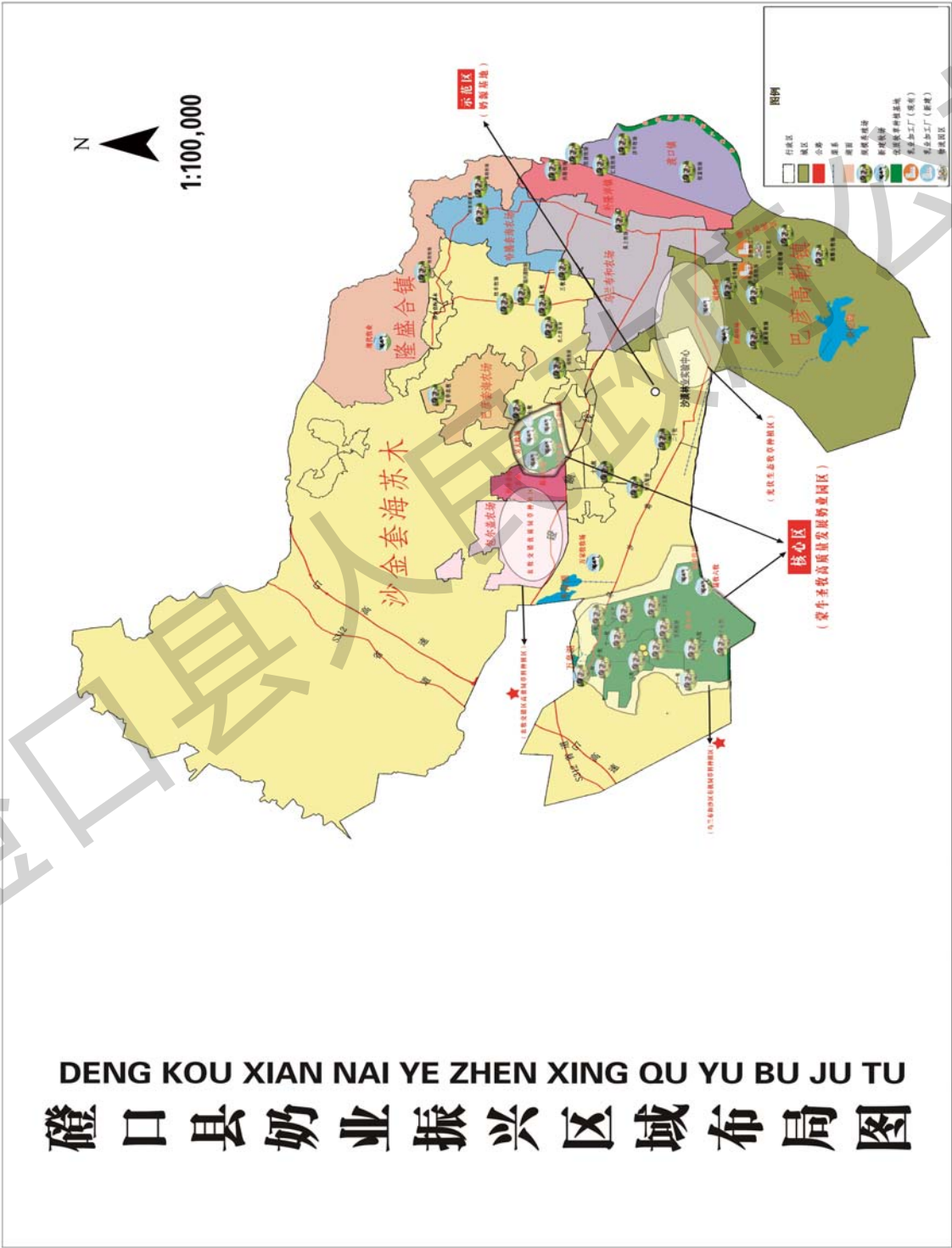
附图:磴口县奶业振兴区域布局图

物规范处置,重点推进畜禽粪污无害化处理,优化调整产业结构,重点开展农牧结合、立体种养生态循环农牧业,最大限度地减轻环境影响,促进区域生态环境安全和农畜产品质量安全。